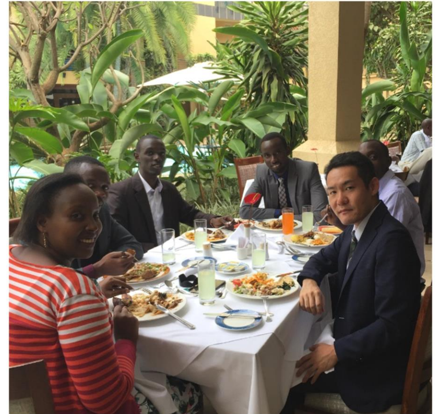
ルワンダ元専門調査員