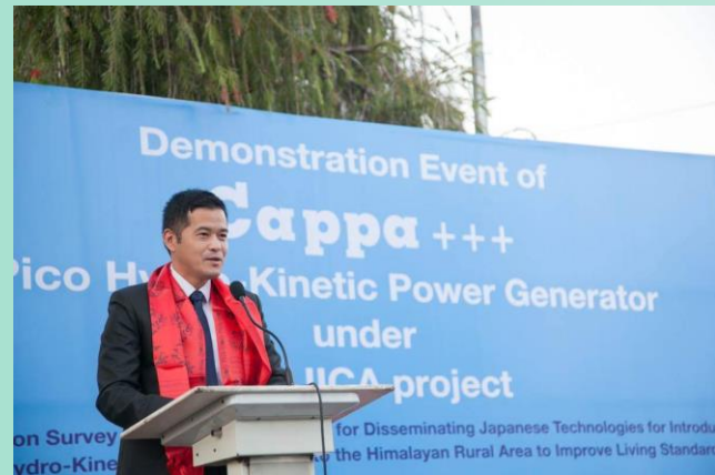
ネパール 元専門調査員