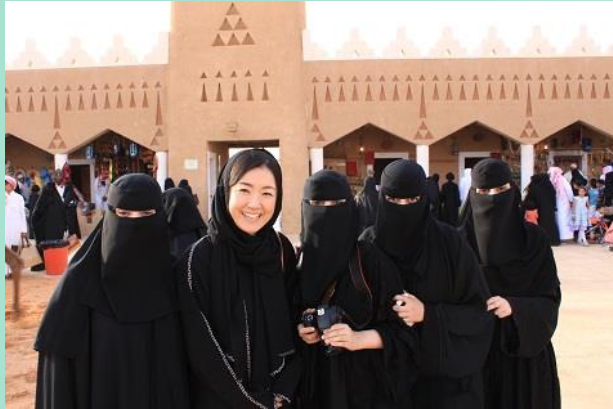
サウジアラビア 元専門調査員